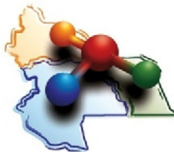
CUYO Federación Bioquímica de Cuyo