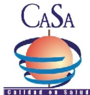
Ca.Sa. Calidad en Salud